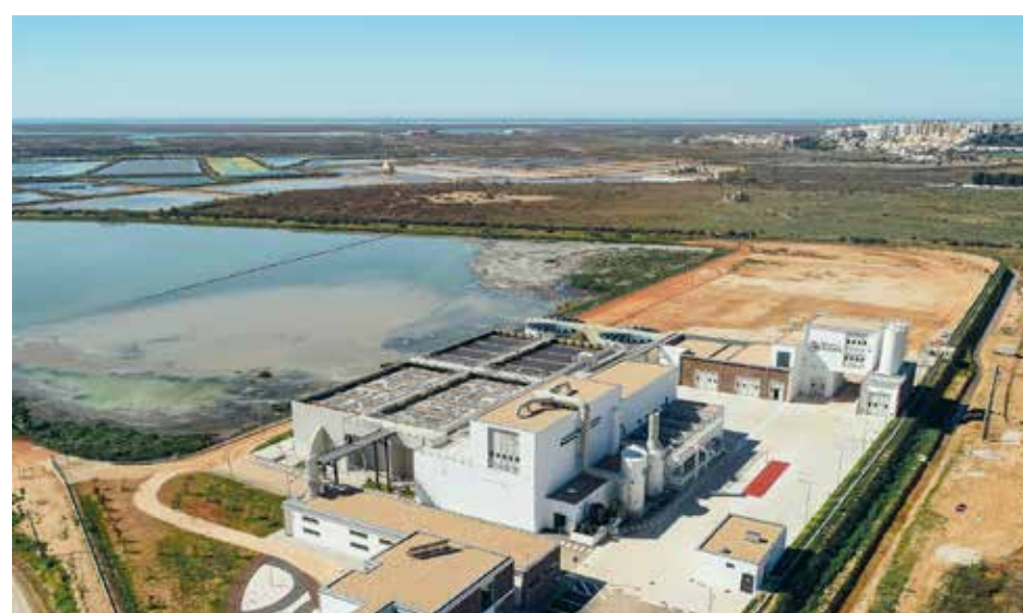
ETAR de Faro / Olhão e Sistema Elevatório de Olhão Projetos PO SEUR - Contribuição Fundo de Coesão: 14.155.603,33 €