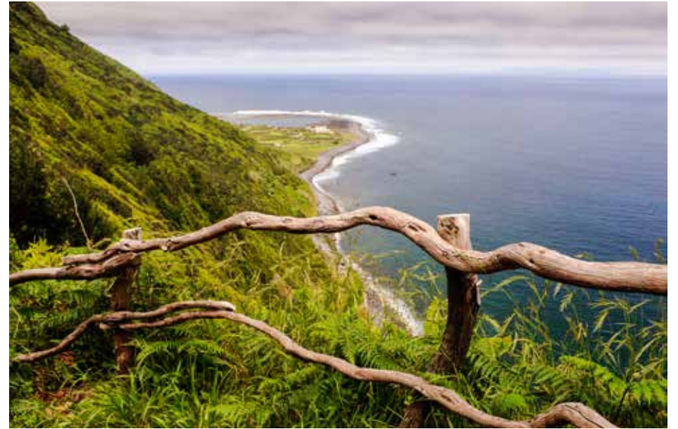
Ilha de S. Jorge - Fajã da Caldeira do Santo Cristo

1ª Cartilha de Sustentabilidade dos Açores tem como principal objetivo ser um fórum de reflexão sobre como promover um desenvolvimento sustentável nos Açores, de forma transsetorial e em todo o arquipélago. Tem ainda como objetivos adicionais: