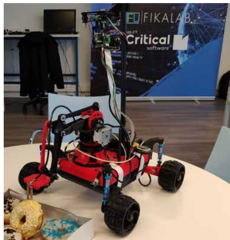
O Fikalab ISEC é o laboratório de criatividade e experimentação que o ISEC montou em parceria com a Critical Software

Como disse Einstein, “É na crise que nascem as invenções, os descobrimentos e as grandes estratégias. Quem supera a crise, supera-se a si mesmo.” O carimbo de excelência do ISEC já era a grande inserção dos seus estudantes no mercado de trabalho. A partir de agora, será também o facto de sermos a escola de engenharia em Portugal que melhor recriou o seu ensino para, quer nas plataformas digitais, quer nos seus laboratórios, formar os engenheiros do futuro.