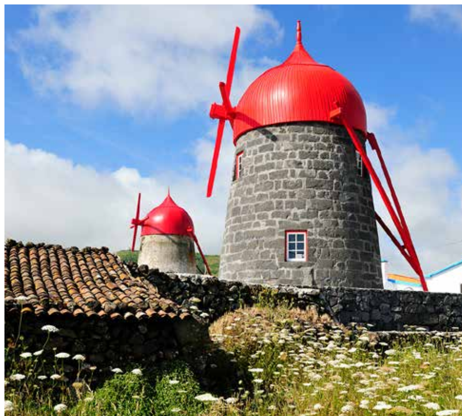
Ilha Graciosa - Moinho

Sendo os Açores uma região segura, de baixa densidade populacional, com cerca de 100 habitantes por Km 2 , o único arquipélago do mundo certificado como destino sustentável, com uma natureza intocável e com uma oferta turística diversificada ao nível de atividades ao ar livre, temos argumentos muito apetecíveis para atrair os viajantes que procuram uma oferta turística de qualidade, exclusiva e acima de tudo segura.