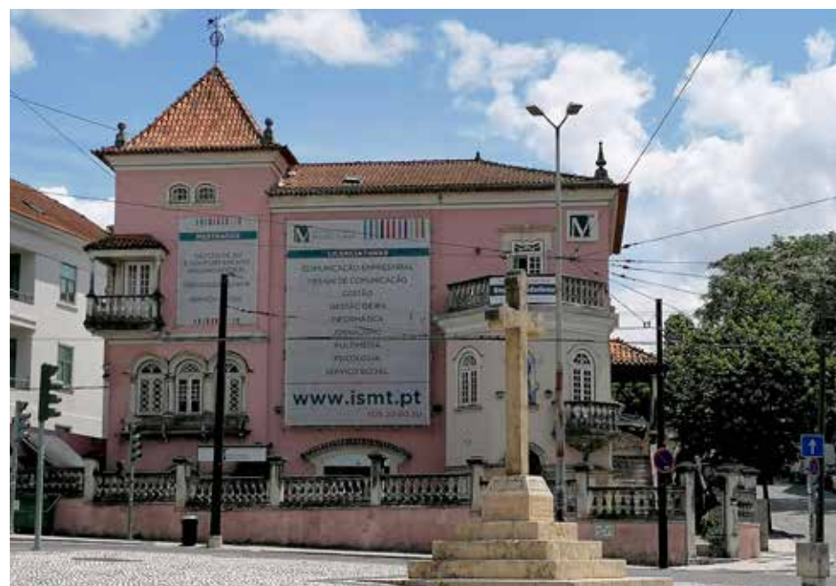
Edifício sede do Instituto Superior Miguel Torga no coração da alta de Coimbra

Existe também uma procura de jovens de países da Europa Central, porque Portugal é mais compatível com o seu poder de compra e pela qualidade do ensino no nosso país, reconhecido internacionalmente. Esta é uma afirmação da nossa cultura, mas também é esse o papel do ensino.