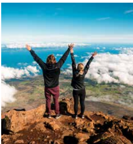
Ilha do Pico - Montanha