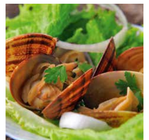
Prato Típico - Amêijoas