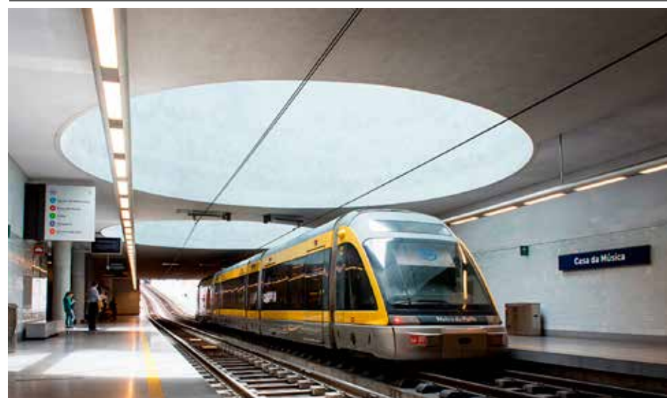
Extensão do Metro do Porto: Linha Rosa (Casa da Música – São Bento) e Linha Amarela (Santo Ovídio - Vila D'Este) 2 Grandes Projetos PO SEUR aprovados pela Comissão Europeia - Contribuição Fundo de Coesão: 107.000.000,00 €