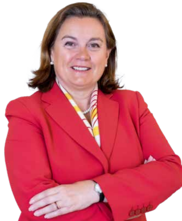
Ana Paula Zacarias, Secretária de Estado dos Assuntos Europeus

Relativamente à Europa, à família europeia, além de termos retomado a importância da políticas públicas, a importância dos mecanismos de solidariedade, um dos grandes desafios atuais é como enfrentar a situação económica em que nos encontramos: sermos capazes de ter uma cooperação intensa para evitar a propagação do vírus, conseguirmos assegurar o fornecimento do equipamento médico e de proteção individual; conseguirmos promover a investigação relacionadas com diagnóstico, terapia e na