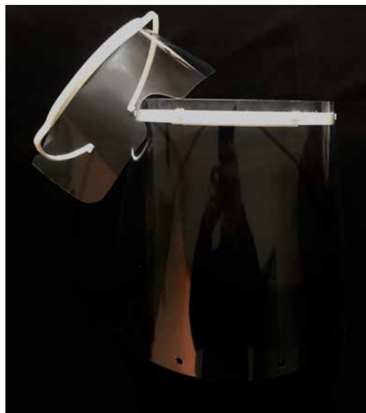
Os óculos e viseira produzidos pelo ISEC