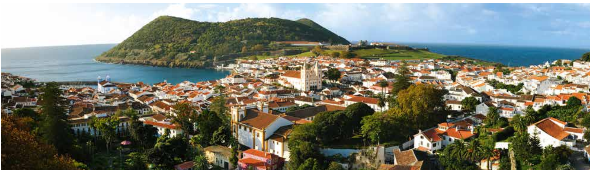
Ilha Terceira - Monte Brasil (Angra do Heroísmo)

Estas nove ilhas atlânticas proporcionam momentos de aventura, adrenalina e lazer havendo uma panóplia de possibilidades de actividades de acordo com os interesses de cada corajosos participantes.