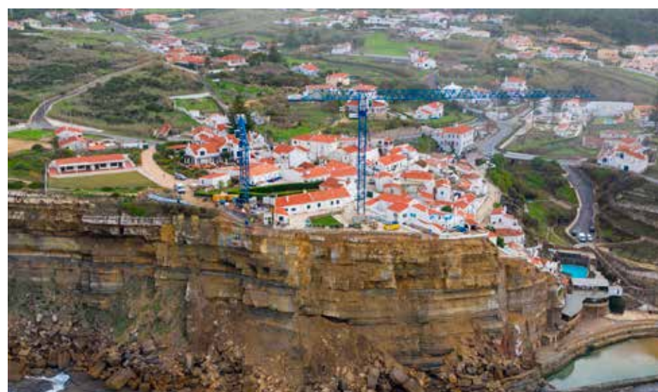
Minimização do risco nas arribas das praias do Magoito, Azenhas do Mar e S. Julião Projetos PO SEUR - Contribuição Fundo de Coesão: 3.044.112,55 €