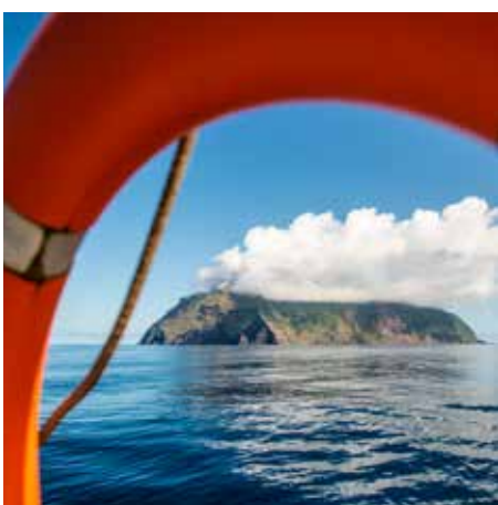
Ilha do Corvo