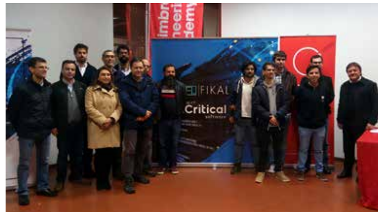
Equipa de trabalho no Fikalab