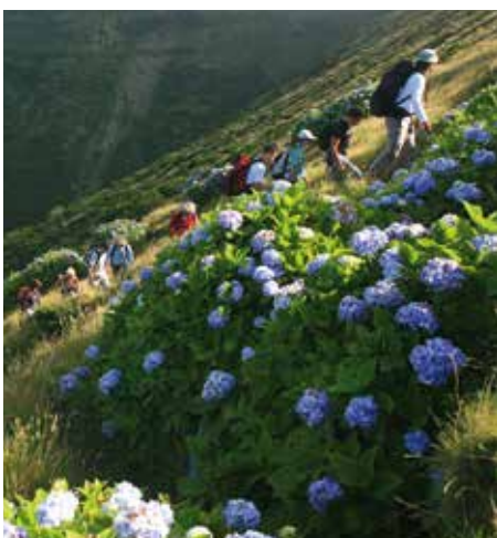
Ilha do Faial - Caldeirão

Lagoa das Sete Cidades e a Paisagem Vulcânica da Ilha do Pico, Maravilhas Naturais de Portugal.