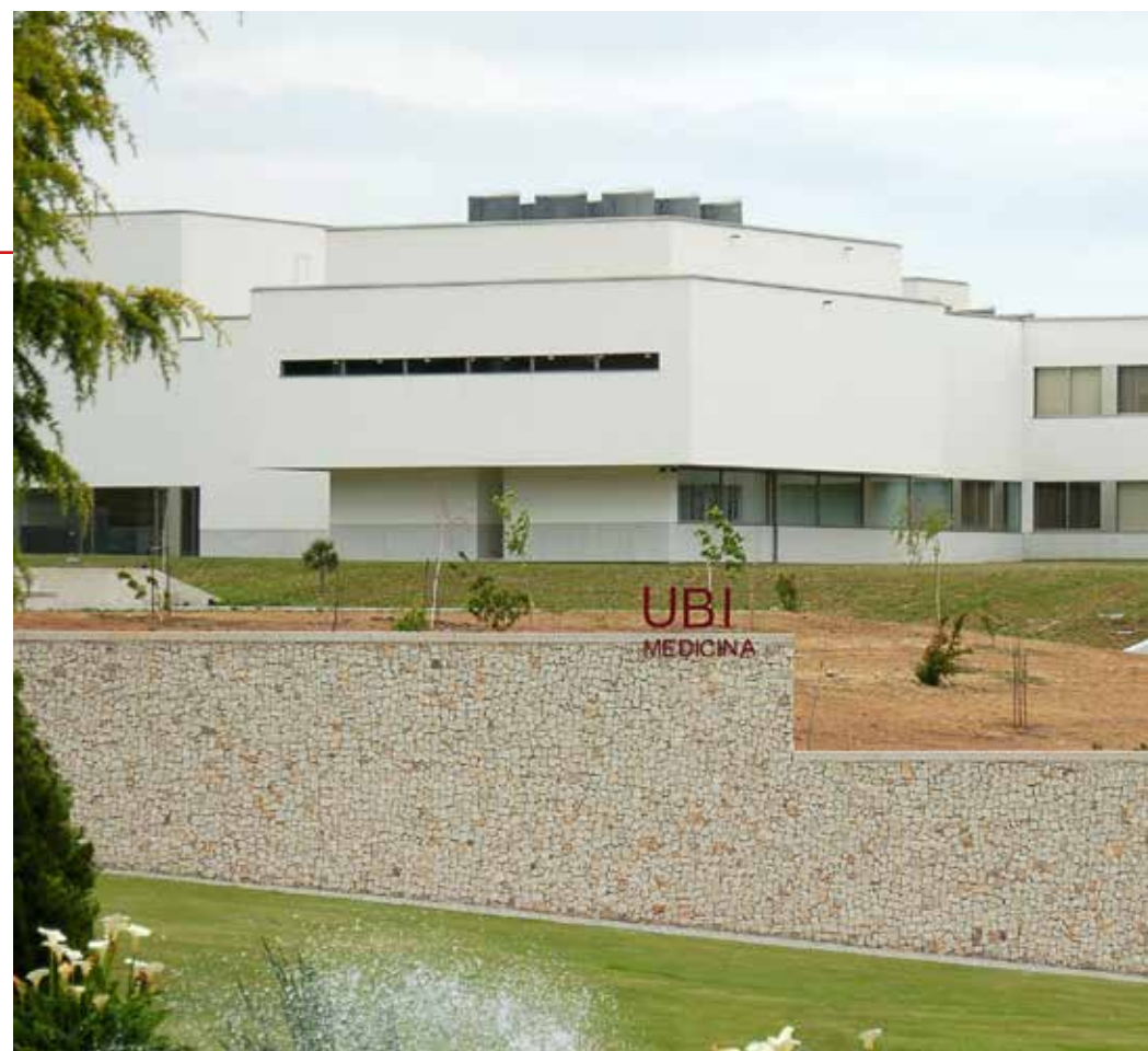
Edifício da Faculdade das Ciências da Saúde da Universidade da Beira Interior

Considero que a principal aprendizagem a retirar desta realidade que nos encontramos a viver, diz respeito ao fator imprevisibilidade. Ficamos todos com a noção que não existe controlo sobre este tipo de situações, elas aparecem, ameaçam e desafiam-nos sem qualquer aviso prévio. Isto obriga-nos a refletir e concluir que temos de estar sempre preparados para agir em situações de crise, sem vacilar temos de enfrentar um cenário de sobrecarga de trabalho e muita tensão. Tratando-se de uma epidemia que coloca em risco a saúde de toda a população e com uma rápida disseminação da mesma através de contágio, os profissionais de saúde são forçados a colocar em prática todas as suas competências de resiliência e resolução de problemas, assumindo neste caso adicionalmente o risco associado à exposição individual. Também neste contexto é essencial colocar em ação as softskills desenvolvidas, tais como, empatia, comunicação, atitude positiva, inteligência emocional e a capacidade de trabalho em equipa num contexto de grande complexidade ética que também importa desenvolver.