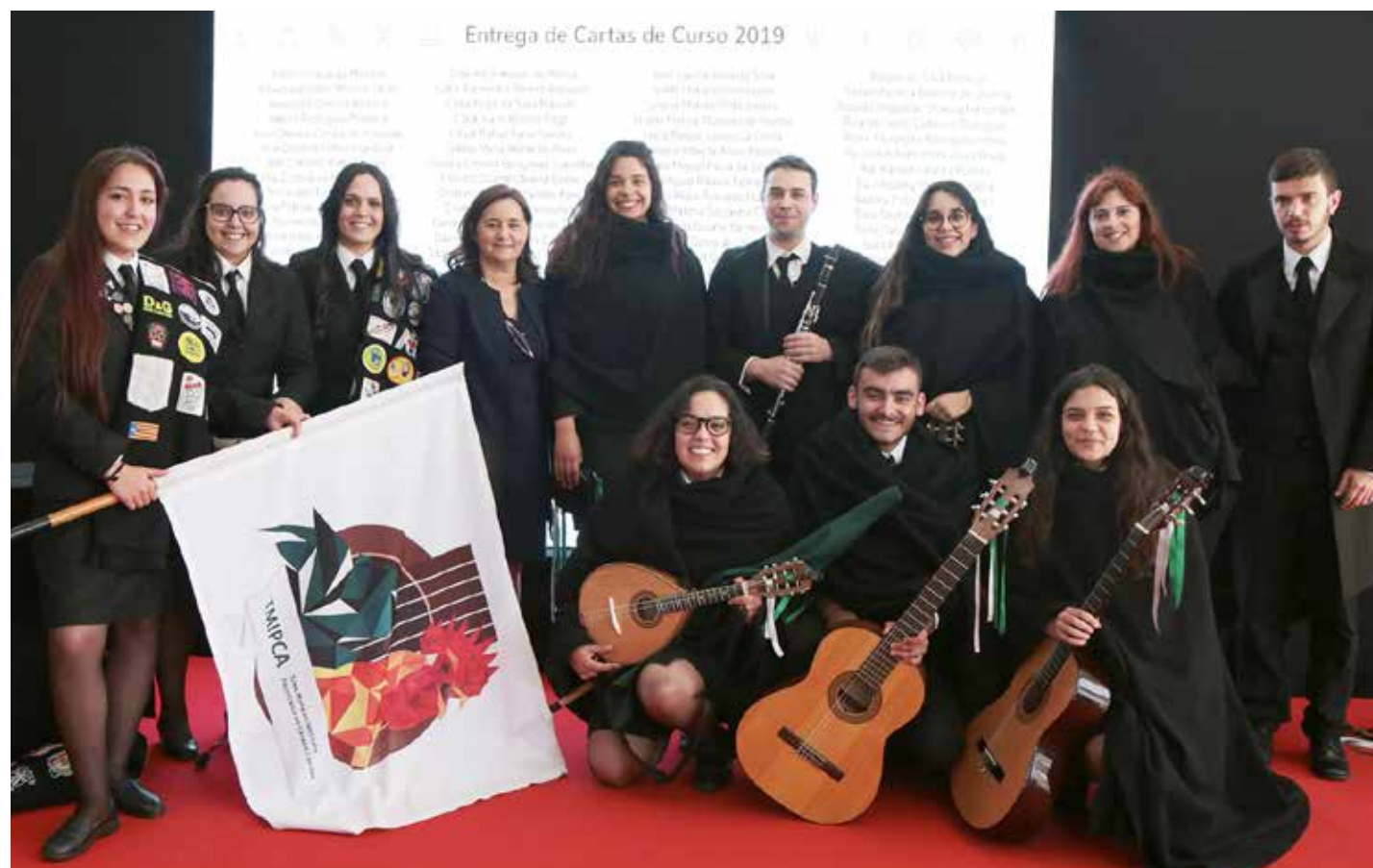
Presidente do IPCA com a Tuna Mista do IPCA na cerimónia de Entrega de Cartas

Quando pensamos o futuro temos de considerar diversos eixos, eixos estratégicos que se interligam entre si. Afirmar e consolidar o IPCA, deu-se a diversos níveis, no crescimento da sua oferta formativa, a expansão a outros concelhos, sempre norteados com a preocupação de responder as necessidades da região e sempre em estreita colaboração com o te-