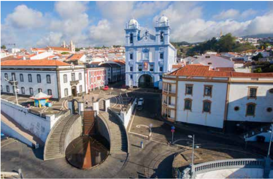
Ilha Terceira - Pátio da Alfândega (Angra do Heroísmo)