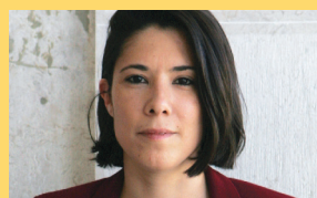
JOANA MORTÁGUA 'Vai ser preciso uma injeção massiva de dinheiro público para salvar pessoas'