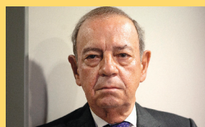
FERRAZ DA COSTA 'Espero tão cedo não voltar a ouvir falar em eutanásia'